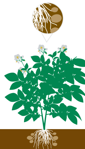
Crescimento de tubérculos