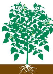
Pegamento dos frutos