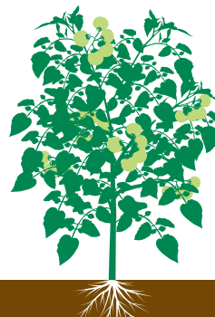
Desenvolvimento dos frutos