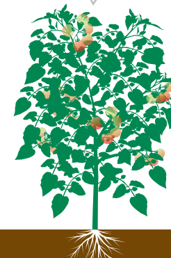
Amadurecimento dos frutos